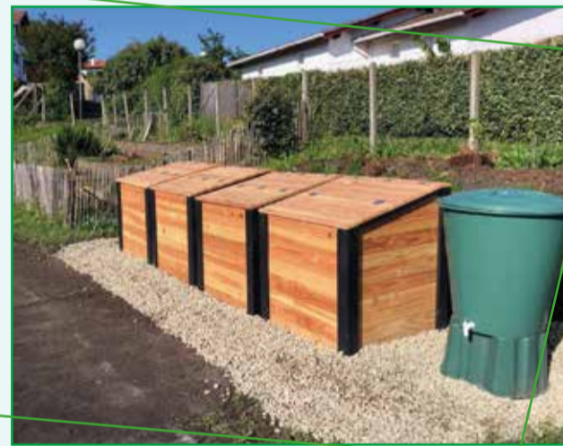
Composteurs en place près du potager

Tout d'abord, il convient de rappeler qu'il s'agit d'une obligation légale fixée par la loi anti-gaspillage avec pour objectif de valoriser les biodéchets. A notre échelle, cela va nécessairement entraîner des besoins d'adaptation mais qui vont dans le bon sens et correspondent à la labellisation Ecole en Démarche de Développement Durable. Après une phase de réflexion qui nous a permis de quantifier les équipements nécessaires et de planifier l'organisation, nous entrerons prochainement sur une phase de test. Et comme pour tout nouveau projet, nous évaluerons au fur et à mesure les points à améliorer. En résumé, il faudra