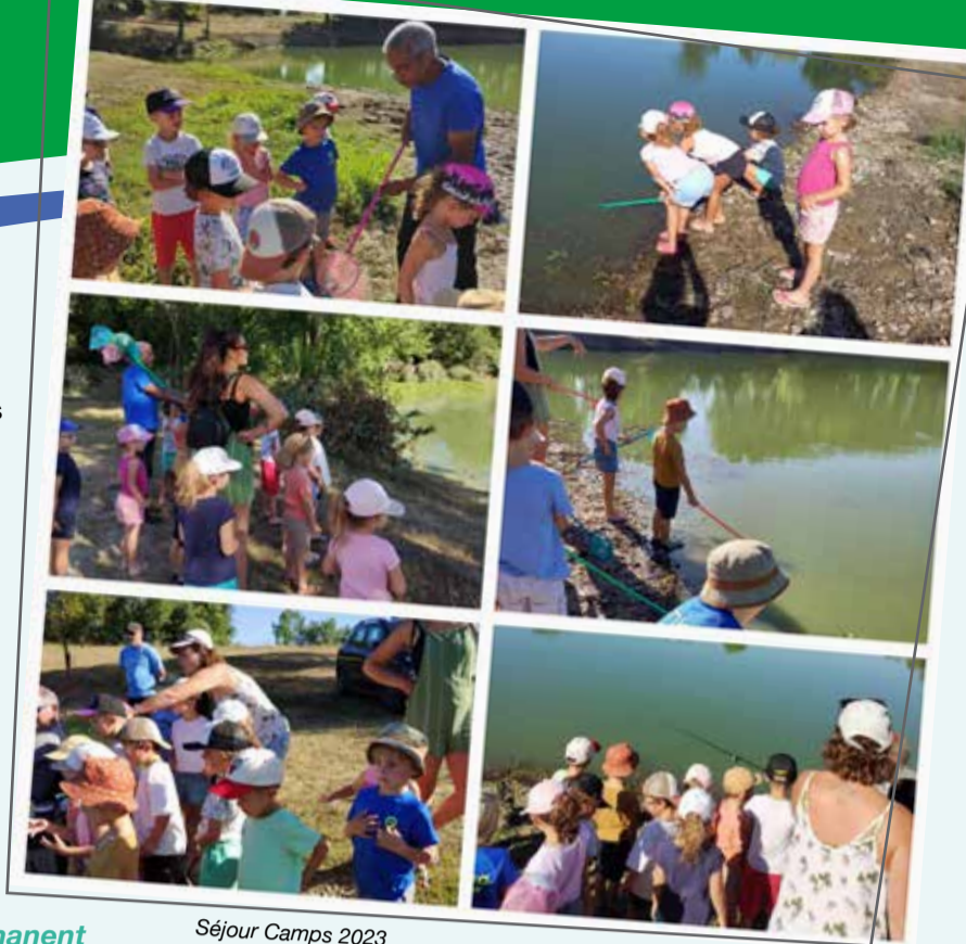
Séjour Camps 2023

patienter quelques temps avant de déguster les légumes du potager de l'école alimenté par le compost interne.