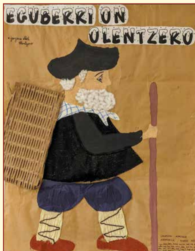
Olentzero, réalisé par les élèves de l'école maternelle de Lahonce. Olentzero, Lehuntzeko Ama eskolako ikasleek eginik.

Elkarrizketa hori, kiroldegi gela tipian pasatu zen. Olentzero eskertzen dugu.